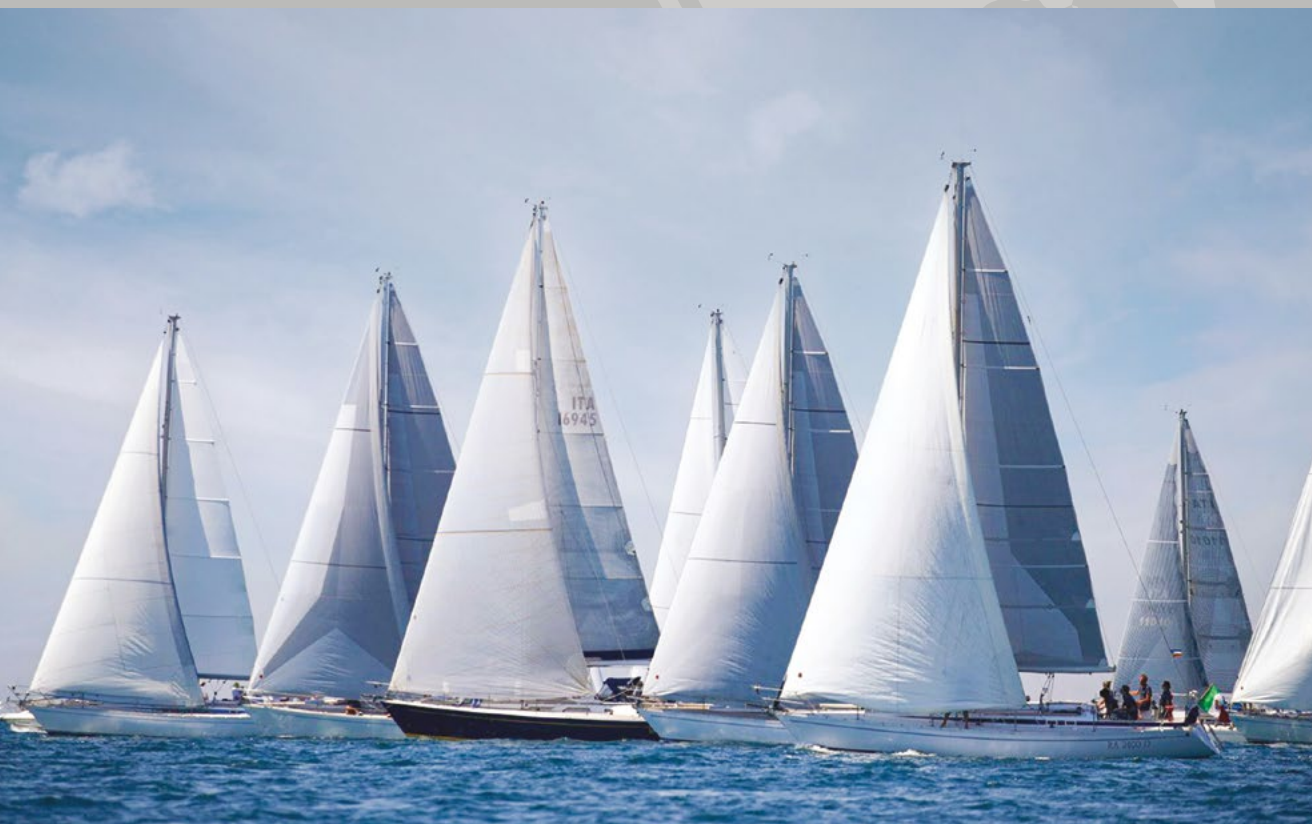
GRAND SOLEIL VINTAGE CUP - PORTOPICCOLO