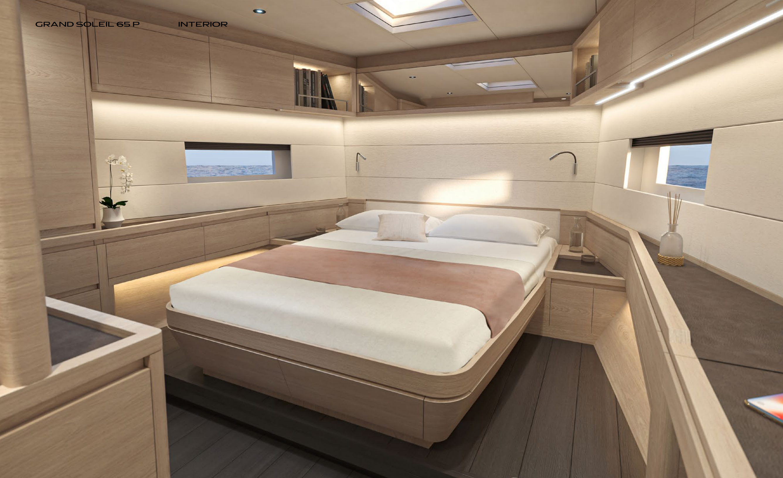
GRAND SOLEIL 65 P INTERIOR