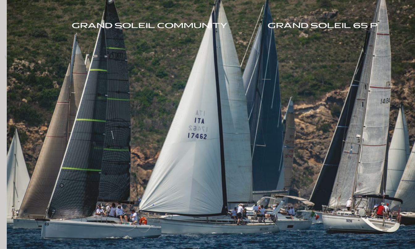
GRAND SOLEIL 65 P