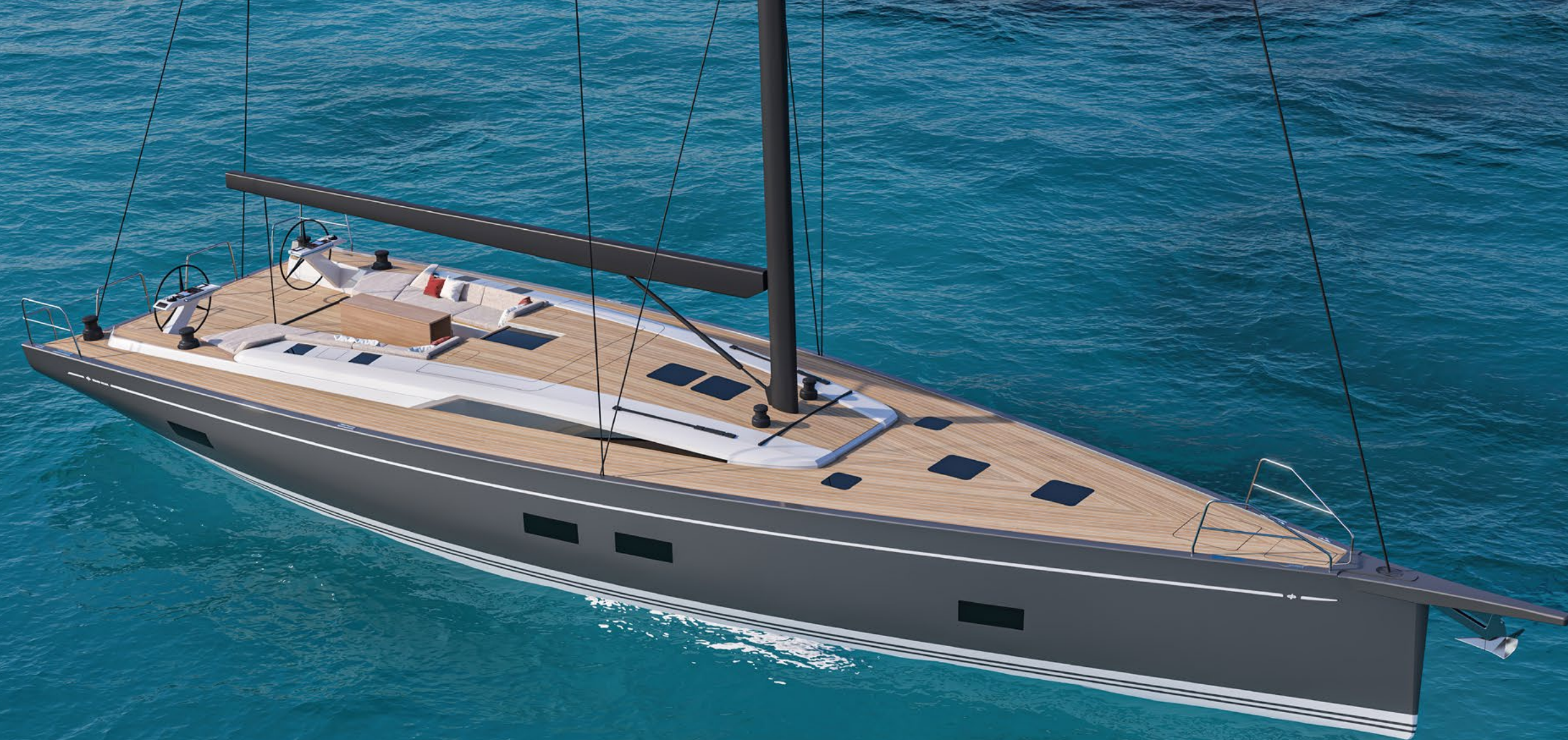
GRAND SOLEIL 65 PERFORMANCE