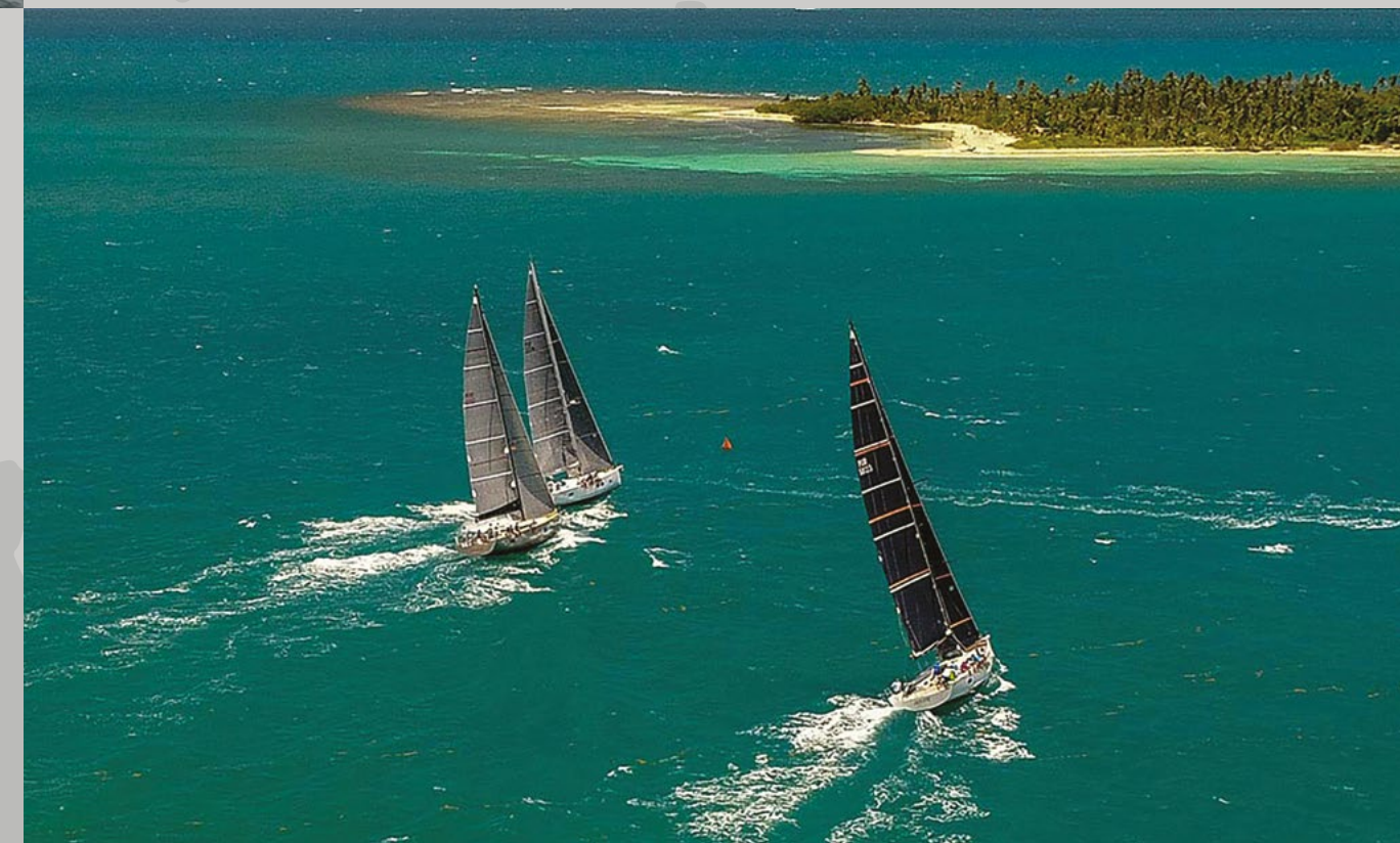
GRAND SOLEIL CUP - PUERTO RICO