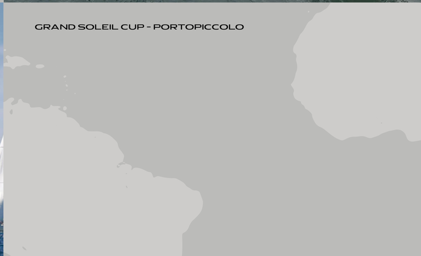
GRAND SOLEIL CUP - PORTOPICCOLO